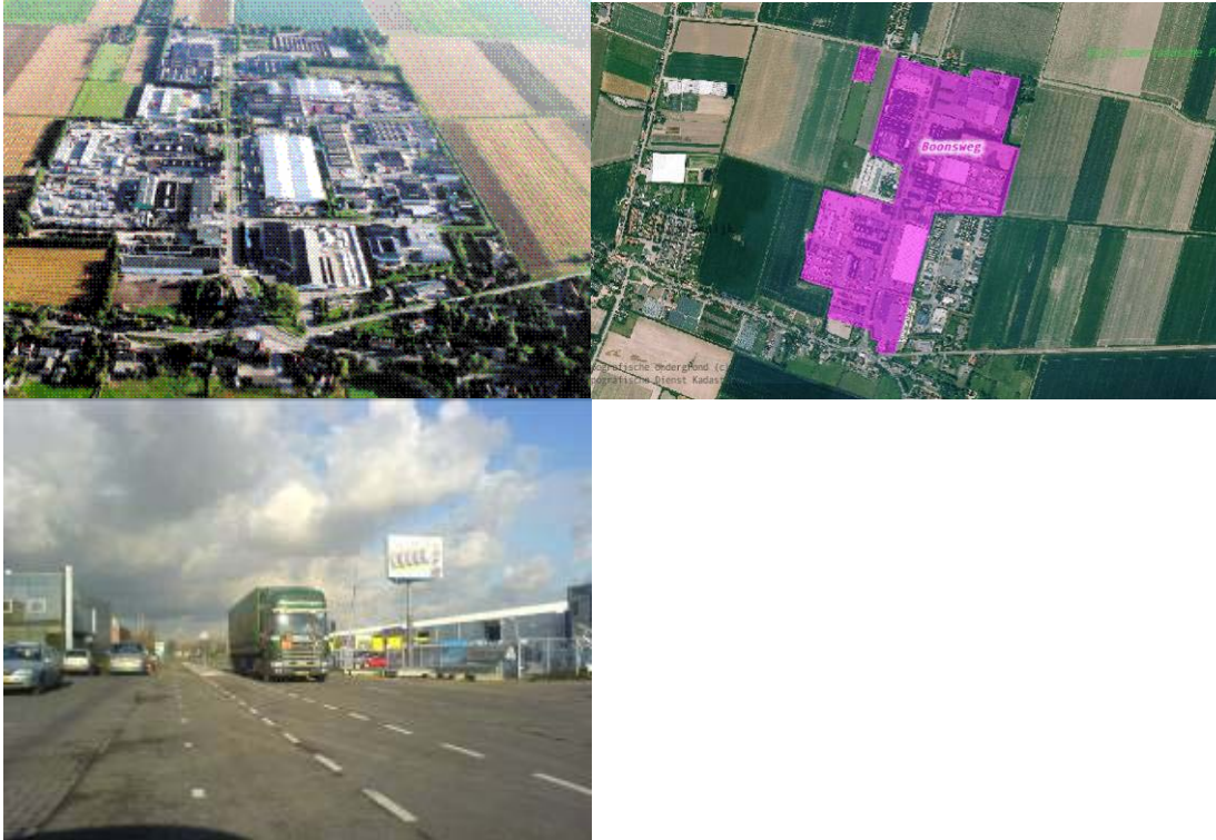
Figuur 1: ligging en impressie terrein