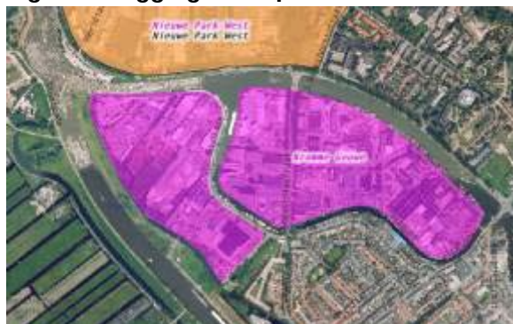
Figuur 1: ligging en impressie terrein