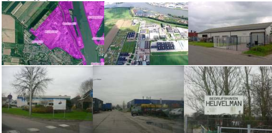
Figuur 1: ligging en impressie terrein