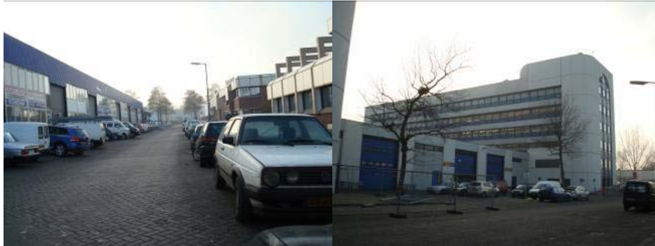
Figuur 2: impressie bedrijventerrein 's-Gravelandse Polder