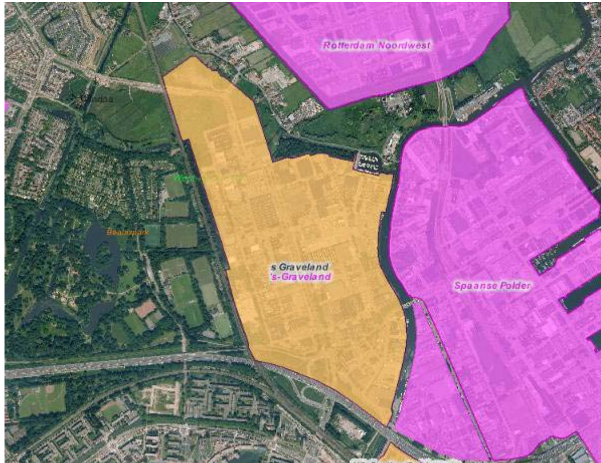
Figuur 1: ligging en impressie bedrijventerrein